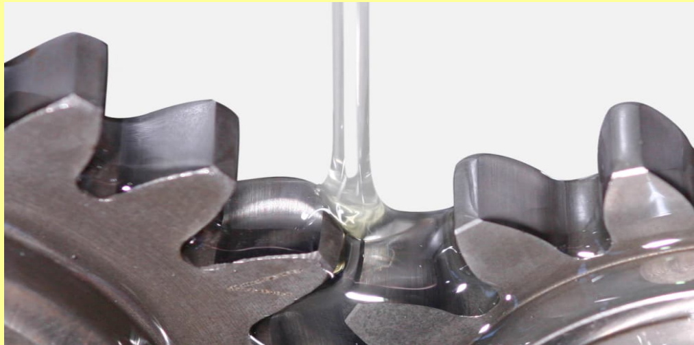
Tabelle E-dm Biologisch abbaubare Öle für FLENDER Marinegetriebe mit Lamellenkupplung

Table E-dm Biologically degradable oils for FLENDER marine gear units with multi-disc clutch